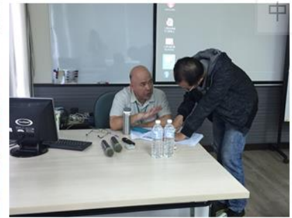
(108年機械廠企業包班)